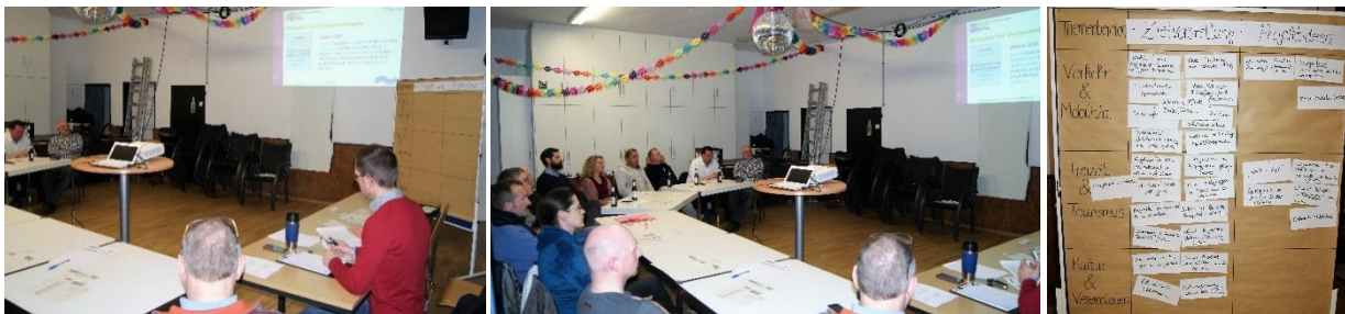
Impressionen AK 2: „Gimbte – aktiv und mobil“, am 26.02.2018 im Jugendheim um 19.30 Uhr