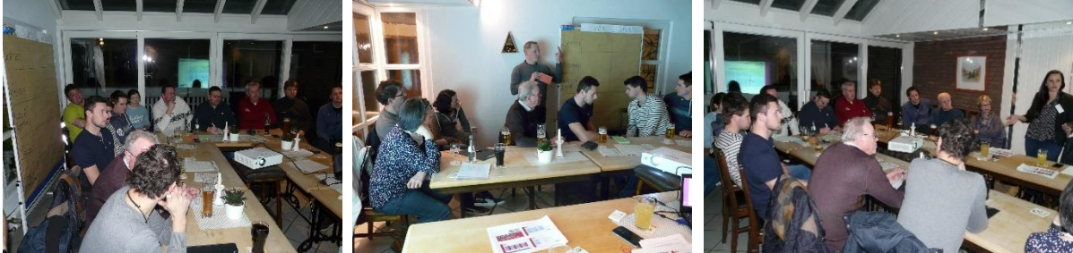
Impressionen AK 1: „Gimbte – lebens- und liebenswert“, am 21.02.2018 im Hotel Schraeder um 19.30 Uhr

(Wohnen, Versorgung, Kinder/Jugend, Senioren, Dorfgemeinschaft)