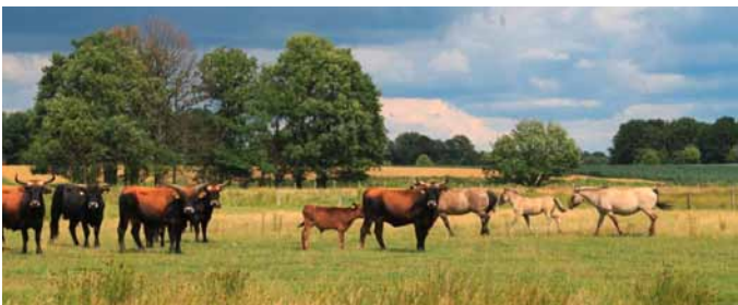
Heckrinder und Konikpferde in der Emsaue Telgte

flussbegleitende Dünen, Röhrichte und Feuchtflächen. Um die fast ursprüngliche Naturlandschaft der Emsaue zu erhalten, gilt für die Ems im Münsterland eine Befahrensregelung für Wassersportler.