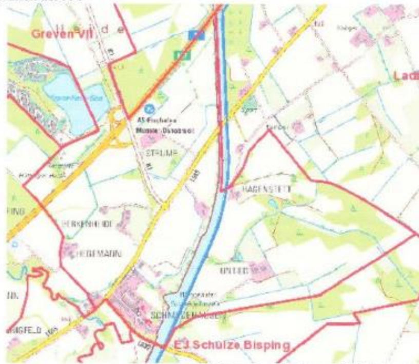
Teil des Jagdbezirktes südlich der A 1