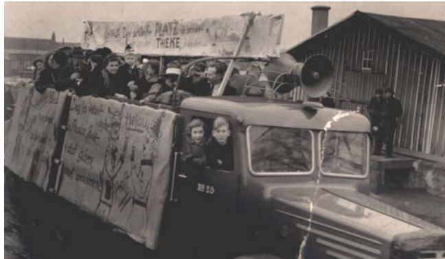
Karnevalsumzug des Schützenvereins Bahnhof, 1952

Der erste Karnevalsumzug nach dem II. Weltkrieg fand 1952 statt. In diesem Jahr beschloss der Schützenverein Bahnhof einen Umzug durchzuführen. Im Jahr darauf führte der erste offizielle Karnevalsumzug durch die Stadt.