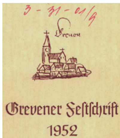
Die Festschrift zur Wiedervereinigung im Jahr 1952

Am 4. April 1952 sandte der Landkreis den Erlass an die Amtsverwaltung Greven weiter, die ihn am 7. April der Presse zur Veröffentlichung bekanntgab. Erstmals veröffentlicht wurde er im Amtsblatt der Bezirksregierung Münster am 5.4.1952. Der Termin des Zusammenschlusses dürfte tatsächlich, wie schon Dr. Drost vermutete, im Hinblick auf die im Herbst 1952 stattfindenden Kommunalwahlen gewählt worden sein.