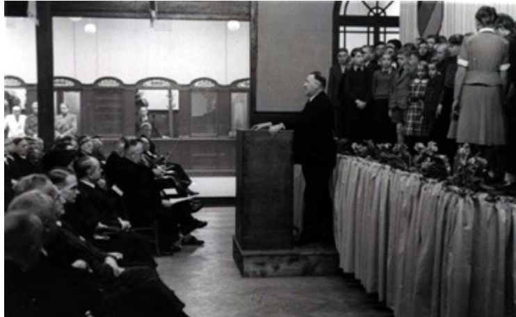
Regierungspräsident Hackethal bei der Stadtwerdungsfeier 1950

Die Denkschrift zitiert die Entscheidung zu Gesprächen durch den Gemeinderat Greven l.d. Ems als positiv und konstatiert, dass eine solche Entscheidung der Gemeinde Greven r.d. Ems nicht vorliege. Die anstehenden Gespräche mit Greven l.d. Ems werden als Anlass genannt, die Veränderungsmöglichkeiten der Gemeindegrenzen durch die Denkschrift zu zeigen. Die Entscheidung liege letztlich bei der Landesregierung NRW.