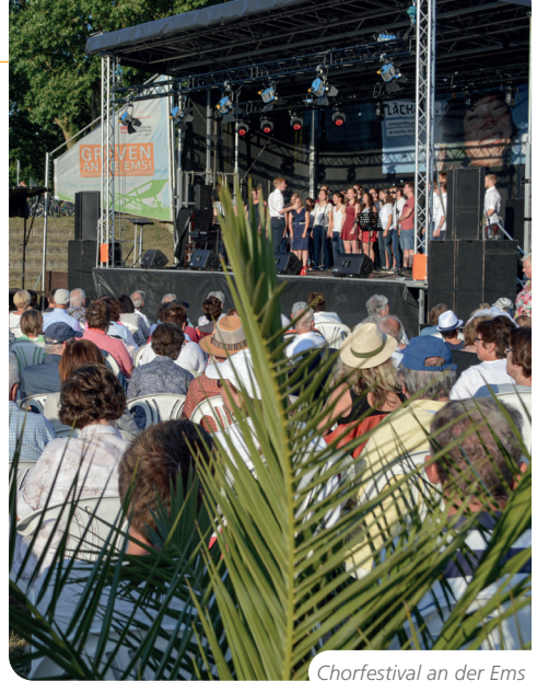
Chorfestival an der Ems

Auch hier ist die Bandbreite immens. Im Kulturzentrum GBS tut sich die Kulturinitiative genreübergreifend mit hochkarätigen Konzerten hervor. Der Beatclub verfügt mit dem vereinseigenen Beatclubkeller über eine Location, die mit ihrer besonderen Atmosphäre für Blues, Rock und auch kleine Klassikkonzerte wie geschaffen ist. Mit dem BeatclubFestival im Rahmen von „Greven an die Ems!“ präsentiert der Verein im Sommer ein großes Rockevent für das große Publikum. Die Konzertinitiative Emsboom und das Kesselhaus im Kulturzentrum GBS sprechen mit ihren Rockkonzerten, wie dem „Backyardfestival“ die Generation „U25“ an. Greven Grass steht für das international besetzte Blue Grass Festival, das alljährlich am Pfingstwochenende am „Emsbeach“ stattfindet. Bei Stadtfesten und der Grevener Musikknacht, einem Frühjahrsereignis in den Kneipen der City, übernehmen auf Einladung von Greven Marketing Coverbands das Ruder.