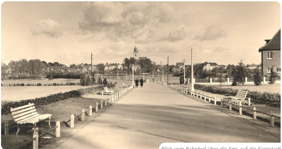
Blick vom Bahnhof über die Ems auf die Kernstadt

Ein Überfall niederländischer Reiter im Jahre 1589 auf den Greverer Markt war Vorbote dunkler Zeiten. Weiteres Elend brachte der 30jährige Krieg. Auch die Jahrzehnten danach standen im Zeichen von Not und Zerstörung: Fünf Feuersbrünste allein zwischen 1655 und 1683, Epidemien und Missernten brachten weiteres Elend. Dennoch ging das Dorfleben weiter. So entstand im 17. Jh. am südlichen Ortsrand der „Hoek“, ein „Ensemble“ von Ackerbürgerhäusern.