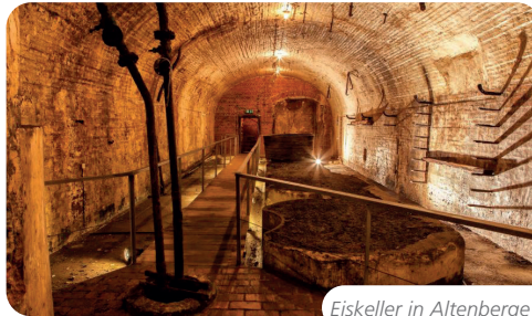
Eiskeller in Altenberge