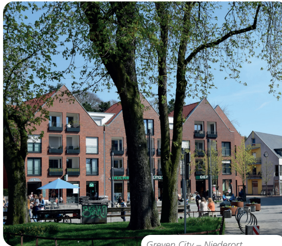
Greven City – Niederort