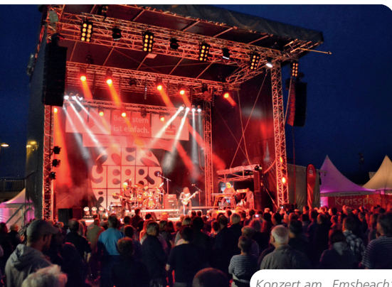
Konzert am „Emsbeach“

Einen hervorragenden Ruf unter den münsterländischen Bühnen hat sich die Freilichtbühne in Reckenfeld erworben. Eine schön gelegene Bühnenanlage mit moderner technischer Ausstattung und ein attraktiver und vielseitiger Spielplan haben dazu beigetragen, dass in den Sommermonaten zehntausende von Besuchern zu den Aufführungen und vielfältigen Sonderveranstaltungen strömen.