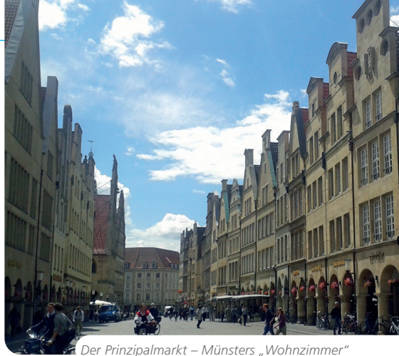
Der Prinzipalmarkt – Münsters „Wohnzimmer“

An der Promenade, der ehemaligen Wallanlage, liegt das barocke Schloss mit attraktivem Park und botanischem