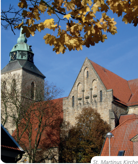
St. Martinus Kirche

Die Struktur der katholischen Kirchengemeinden wurde in den vergangenen Jahren durch die Verschmelzungen erheblich verändert. Unter dem Dach der Kirchengemeinde St. Martinus agieren nun insgesamt sechs ehemals eigenständige Gemeinden gemeinsam. Nur in Gimbe besteht mit St. Johannes Baptist weiterhin eine kleine selbstständige Gemeinde. Auch die evangelische Gemeinde ist orts- teilübergreifend zusammengewachsen. Die Christuskirche in der Kernstadt und die Erlöserkirche in Reckenfeld sind nun zwei Zentren einer Gemeinde.