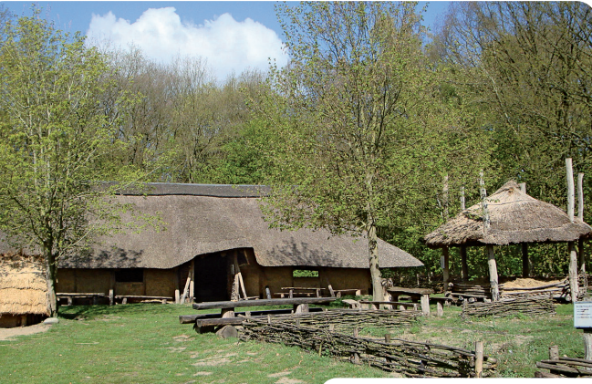
Sachsenhof in Pentrup

Kurz vor dem Emsübergang bei Hembergen sorgt ein 15m hoher Fabrikschornstein für Erstaunen. Er wurde im Rahmen der Skulptur Biennale Münsterland 2001 vom schwedischen Künstler Jan Svenungsson als sein sechster Schornstein in die Landschaft gestellt.