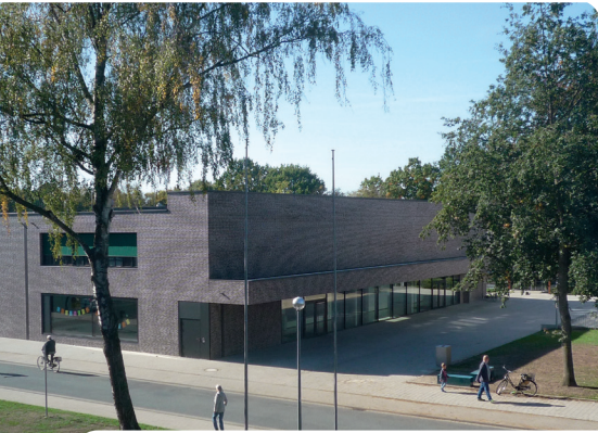
Naturwissenschaftlicher Trakt Gymnasium Augustinianum

private Träger – etwa Bildungs- und Gesundheitszentrum oder die Tastenakademie – haben ein riesiges Angebot an Kursen, Seminaren und Workshops.