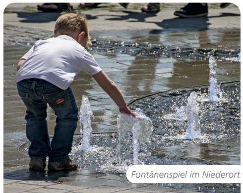
Fontänenspiel im Niederort

An diversen Standorten platzierte Sitzmöbel, „Treibgut“ genannt, dienen nicht nur zum Ausruhen. Hier befinden sich Messingtafeln, die anhand von Berichten und Anekdoten die Bedeutung der Ems für die Geschichte von Stadt und Bürgern verdeutlichen. Auch an vielen Schaltkästen in der City wird Geschichte lebendig: Der Heimatverein präsentiert hier historische Ortsansichten und erläutert die historische Entwicklung des jeweiligen Standortes.