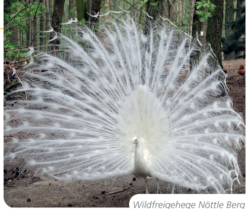
Wildfreigehege Nöttle Berg

In Ladbergen lohnen der malerische Ortskern mit zahlreichen Fachwerkhäusern und der „Friedenspark“ einen Besuch. Altes Handwerk und ländliche Traditionen werden im Heimatmuseum und auf dem Hof Erpenbeck veranschaulicht.